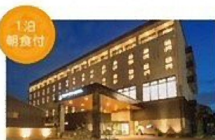
1泊 朝食付 エアポートホテル熊本