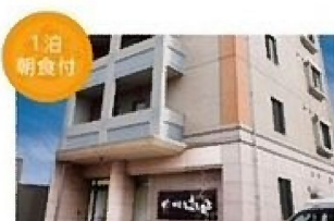
旅籠(はたご)はしもと