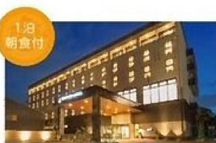
エアポートホテル熊本