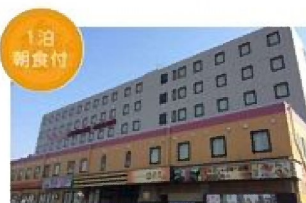
HOTEL AZ 熊本大津店