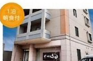
1泊 朝食付 旅館(はたご)はしもと