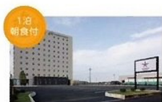
カンデオホテルズ 大津熊本空港