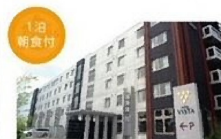
ホテルビスタ熊本空港