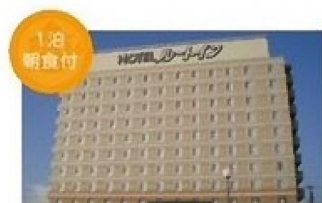
ホテルルートイン 阿蘇くまもと空港駅前