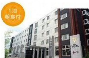
1泊 朝食付 ホテルビスタ熊本空港