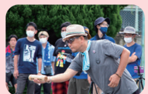
モルック棒を投げるときはとにかく棒をしっかりと持つことを心掛けています。