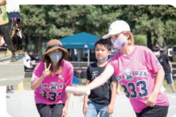
モルッカーの皆さんのファッションにも注目!