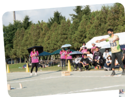
応援も真剣、熱が入ります!