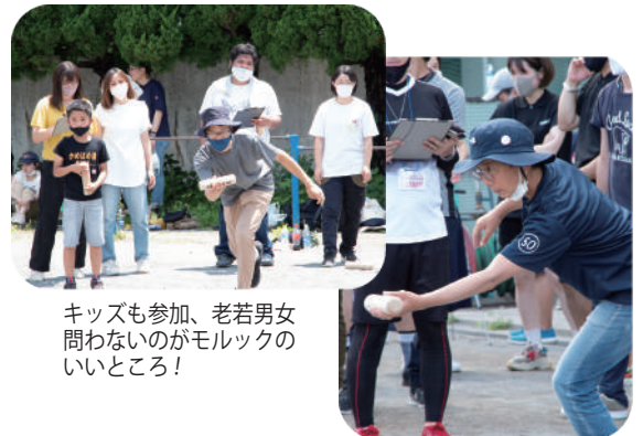
狙いを定めて・・・